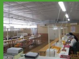
容器詰め工程の自動化