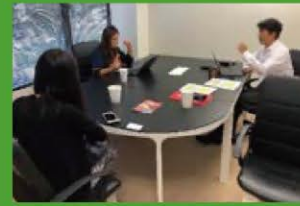
ECとのマッチング支援