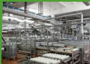
製造工程のオンライン