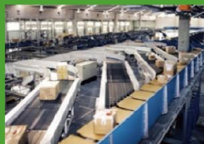
大ロット製造のための機器