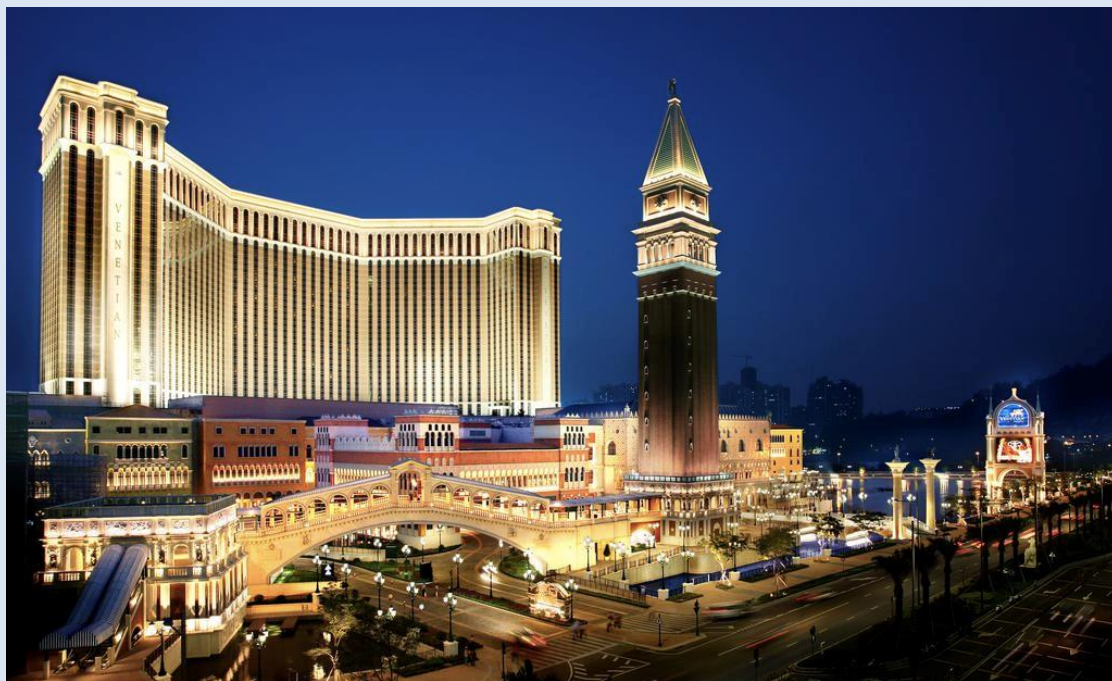
ザ・ヴェネチアン マカオ