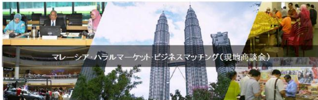
マレーシア・ハラールマーケット・ビジネスマッチング(現地商談会)

【商談会・視察ツアー】マレーシア・ハラールマーケット・ビジネスマッチング(現地商談会)