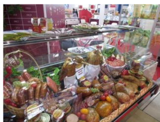
地方の農産品展示