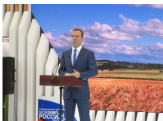
メドヴェージェフ首相開会挨拶